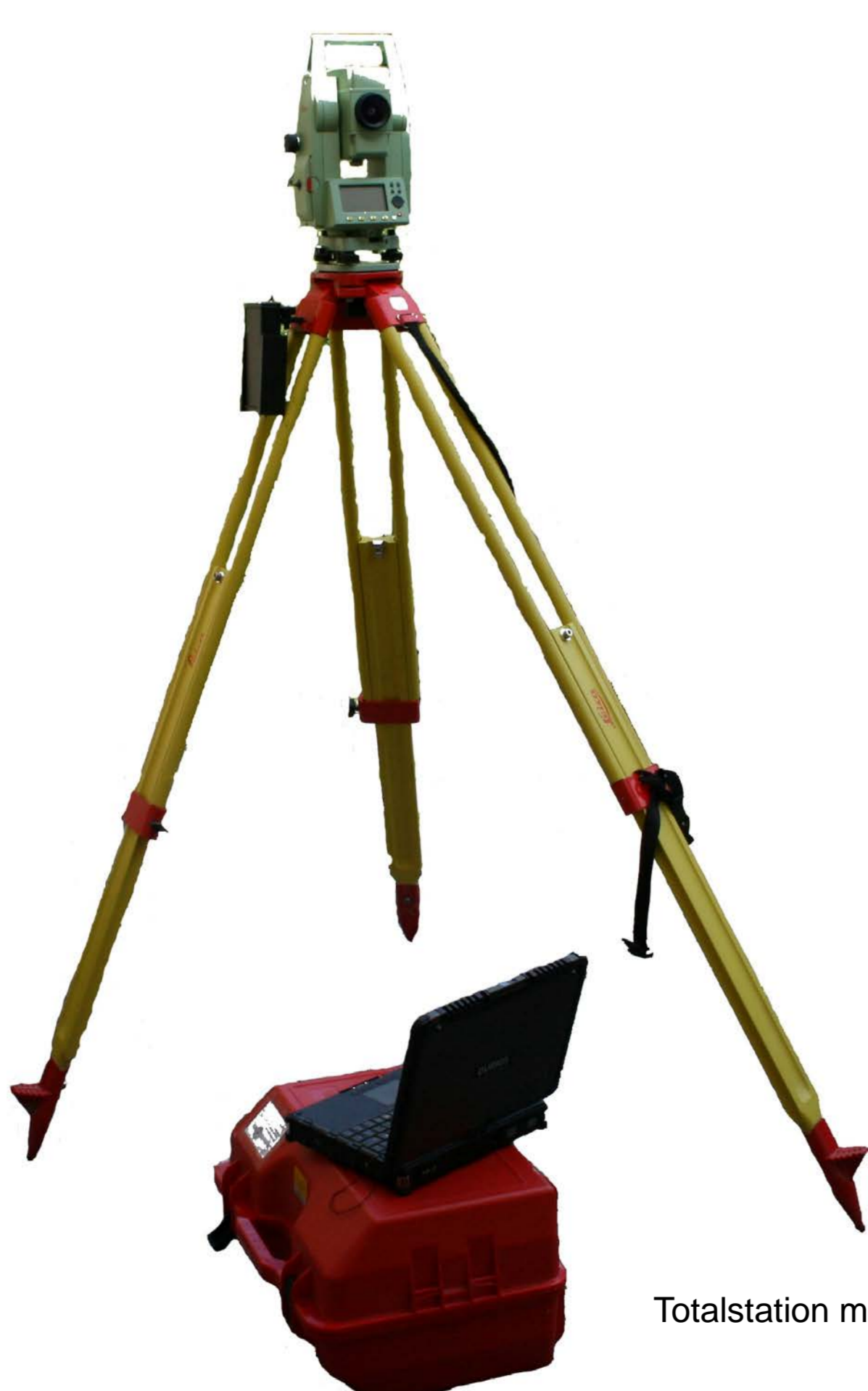
Totalstation mit drahtloser Verbindung zur Steuerungssoftware

befindet sich im hinteren Teil des Topoi-Haus Gartens bzw. bezieht sich auf die dort befindliche archäologische Ausgrabung. Kleine und große Entdecker können hier direkt mit Hand anlegen, die Funde und Befunde unserer Ausgrabung vermessen, in einem Grabungsplan dokumentieren und beschriften. Im Ergebnis können die jungen Wissenschaftler einen fertigen Vermessungsplan als Erinnerung mit nach Hause nehmen.